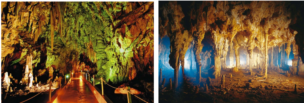
Cave of Alistrati